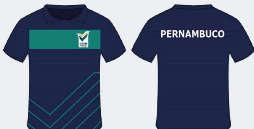
Exemplo: uniforme atleta/técnico TMB Platinum de Seleção Estadual