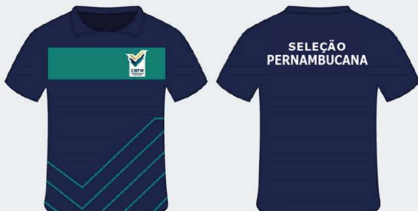
Exemplo: uniforme atleta/técnico TMB Platinum de Seleção Estadual