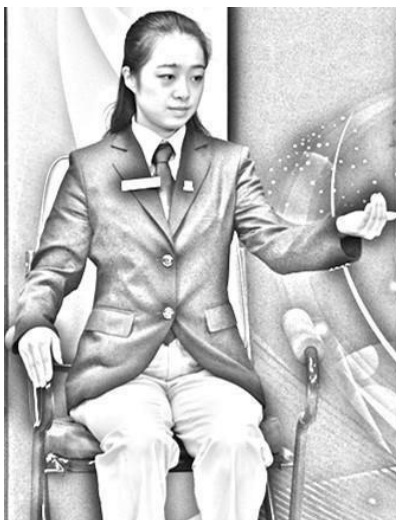
Figura 2 Palma não aberta