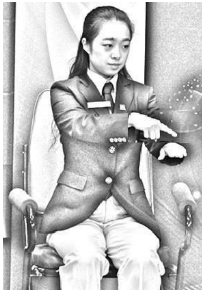
Figura 5 Dentro da linha de fundo