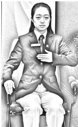
Figura 7 Oculto por algo ou por quem

Se o jogador perguntar por que ou onde, o árbitro usará o dedo indicador para mostrar. Por exemplo: Se a bola está escondida do recebedor pelo ombro do servidor, a ação do árbitro é a seguinte: