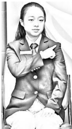
Figura 7 (1) Comunicação verbal: Oculdo pelo ombro