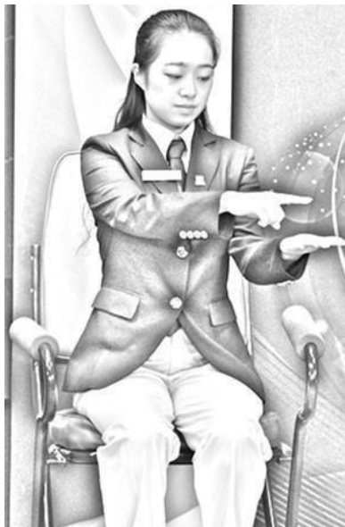
Figura 1 Não é alto o suficiente