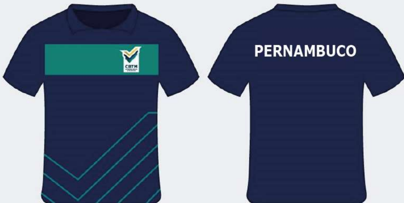
Exemplo: uniforme atleta/técnico TMB Platinum de Seleção Estadual