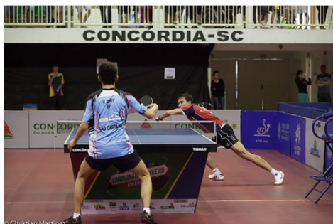
Principais atletas do País estiveram em Concórdia

A cidade de Concórdia recebeu o 52º Campeonato Brasileiro de Tênis de Mesa, entre os dias 27 de novembro e 2 de dezembro. Durante os seis dias de evento, aproximadamente 700 atletas participaram das disputas, juntamente com delegações, acompanhantes e familiares. A movimentação foi intensa e se estima que cerca de três mil pessoas circularam pela cidade e nos municípios vizinhos, lotando hotéis, restaurantes e impulsionando o comércio local.