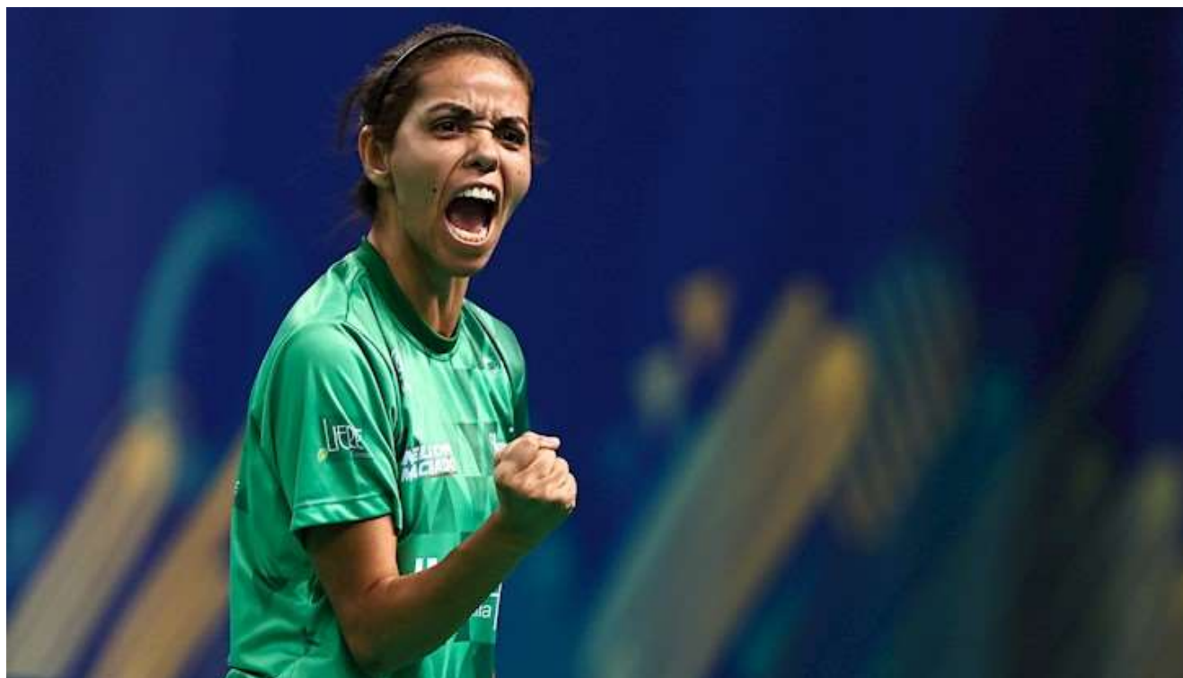
Uberlândia recebe pelo terceiro ano consecutivo o TMB Platinum – Ciclo III