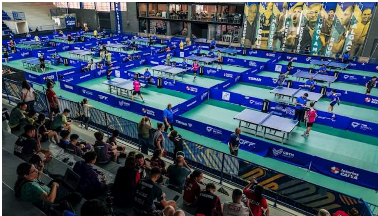
Orientações para entrada no Praia Clube – TMB Platinum – Ciclo III